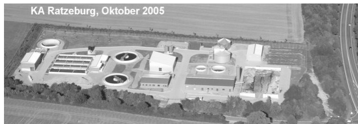
KA Ratzeburg, Oktober 2005

Offiziell eingeweiht wurde die neue Kläranlage bei Einhaus. Es handelte sich um die modernste Anlage ihrer Art im Kreis Herzogtum Lauenburg. 2003 war mit dem Bau begonnen worden, der rund 13 Millionen Euro kostete.